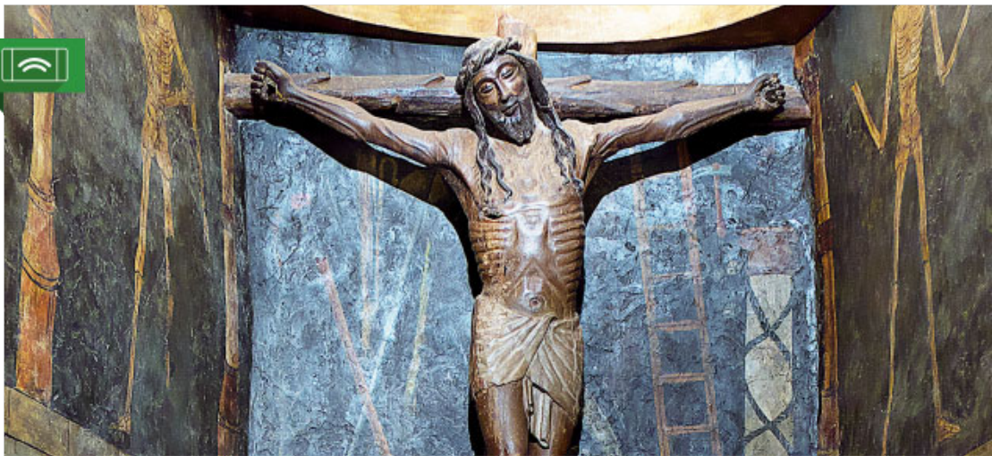
Capella del Crist crucificat (s. XV), Castell de Javier (Navarra)

La pandèmia del coronavirus que estem patint ens està marcant profundament i ens obliga a viure una experiència molt dura: plorar els nostres familiars i amics difunts des de la distància, sense poder-nos-hi acomiadar com es mereixen, sense poder viure el dol amb abraçades reconfortants.