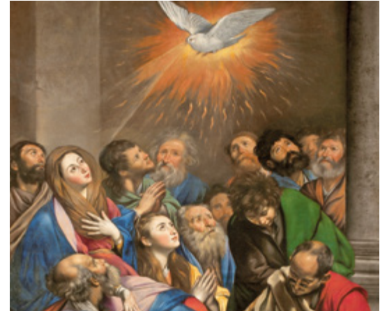
Pentecosta (1612-1614) de Juan Bautista Maíno. Museu del Prado, Madrid (Espanya)