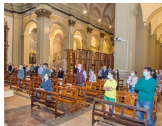
Parròquia de Sant Vicenç de Sarrià

rant la pandèmia de la Covid-19. Preveres i feligresos s'han posat a treballar per garantir-ne la tornada amb les mesures de prevenció requerides pel govern i l'Arquebisbat de Barcelona. Des del primer moment que es va anunciar que s'entraria a la fase 0.5, moltes parròquies expliquen com es van posar a treballar. Rectors, i en alguns casos part de la feligresia, van començar a pensar i organitzar els detalls i protocols per tornar al culte públic, garantint la major seguretat.