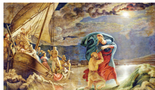
Pere sobre el mar (1806), de Philipp Otto Runge, Kunsthalle d'Hamburg (Alemanya)