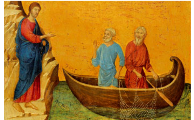
Vocació dels apòstols Pere i Andreu (1308-1311). Retaule de la Maestà de Duccio di Buoninsegna. Museu de la catedral de Siena (Itàlia)