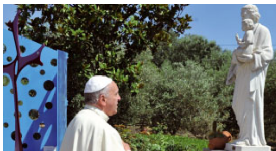
El Papa pregant davant la imatge de Sant Josep, de qui és un gran devot