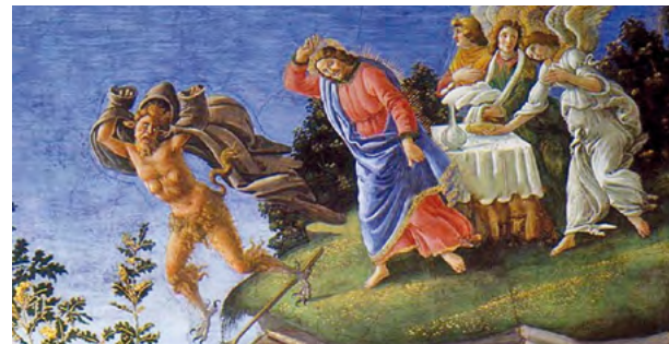
Les temptacions de Crist (1481-1482) de Sandro Botticelli. Capella Sixtina, Ciutat del Vaticà, Roma (Itàlia)