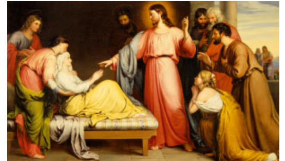
La curació de la sogra de Pere (1839), de John Bridges. Museu d'Art de Birmingham (Anglaterra)